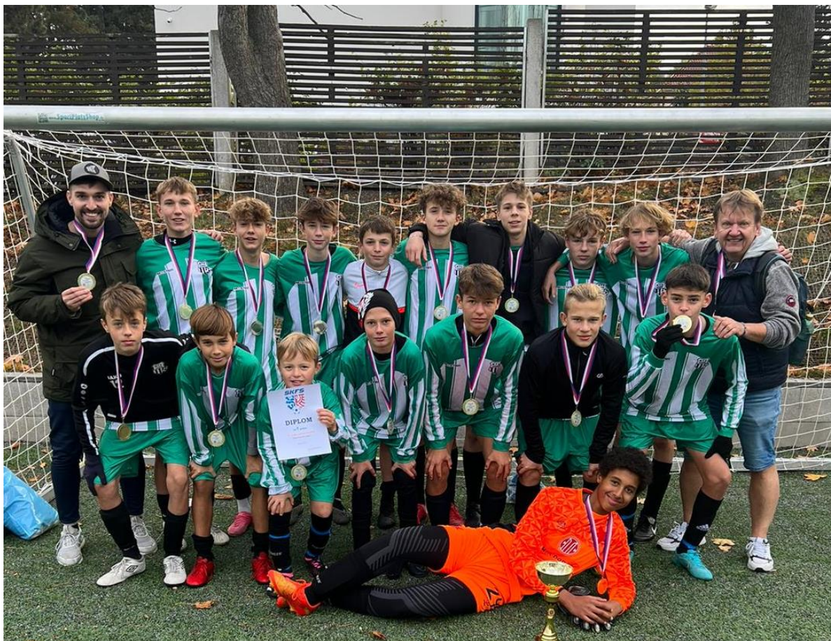
Fotbal FAČR - krajské kolo