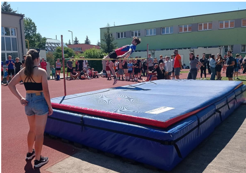
OVOV- okresní kolo