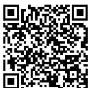
STARka jaro-léto 2024

6. Školní časopis „ STARka “ je tradicí. Vzhledem ke značnému rozsahu školního časopisu je vydáván pod QR kódy. Na tvorbě časopisu se s žáky novinářského kroužku podílejí i ostatní žáci napříč celou školou.