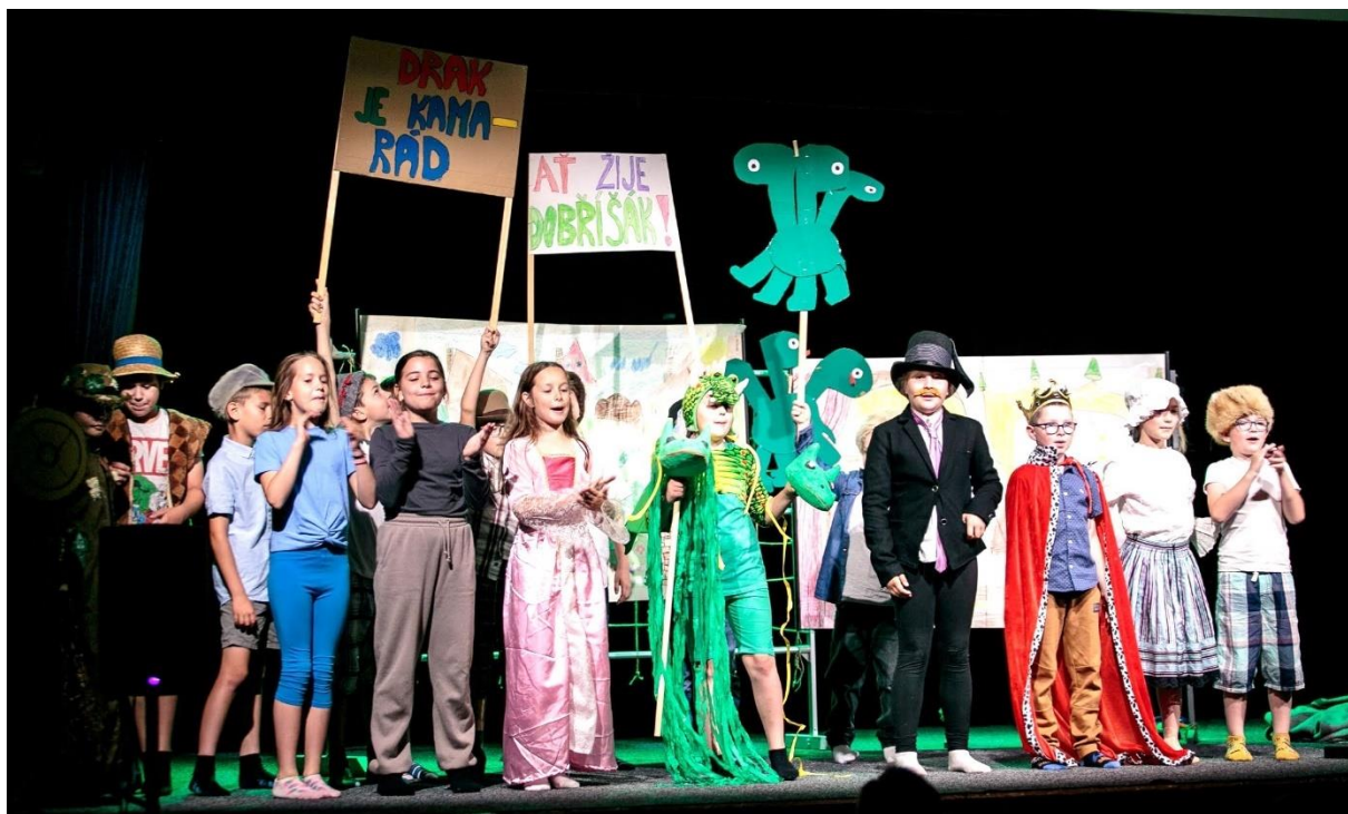
2.ročník dětského divadelního festivalu základních škol School Fest na Dobříši - třída 3. B