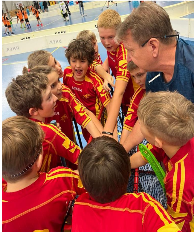
Plavecko-běžecký pohár - okresní kolo Florbal ČEPS Cup - krajské kolo