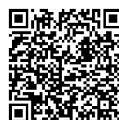
STARka podzim 2023