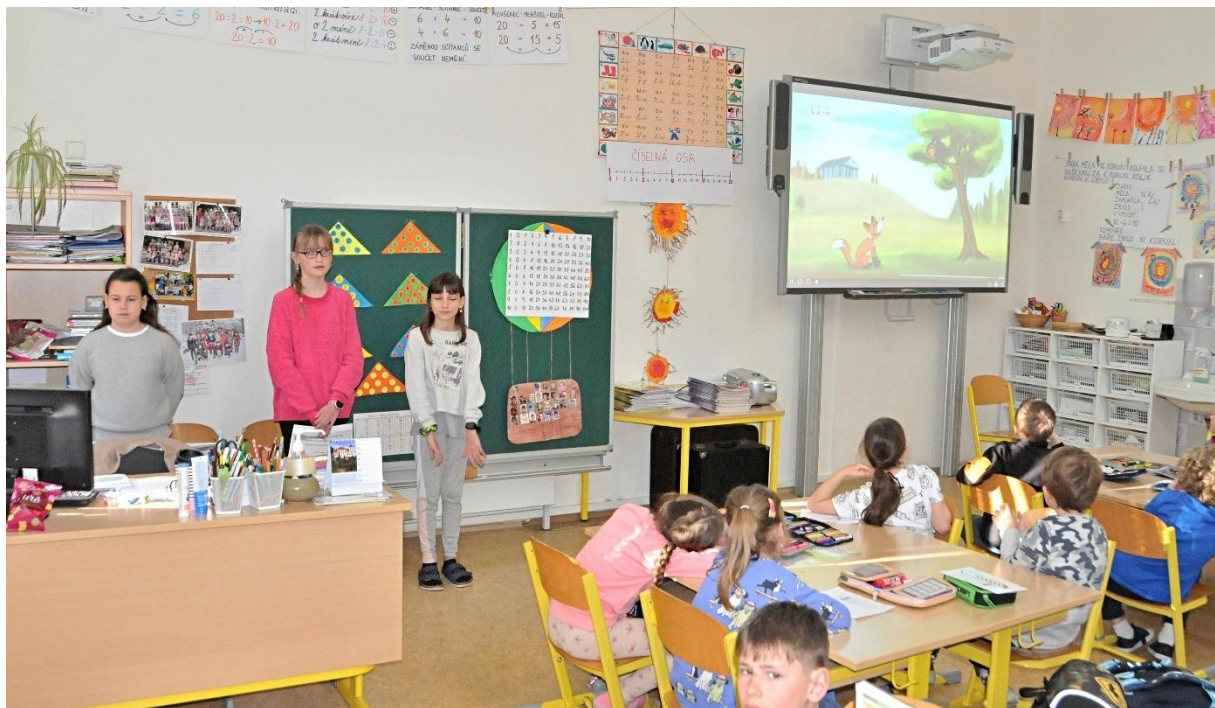
Čtenářská gramotnost - Andersen