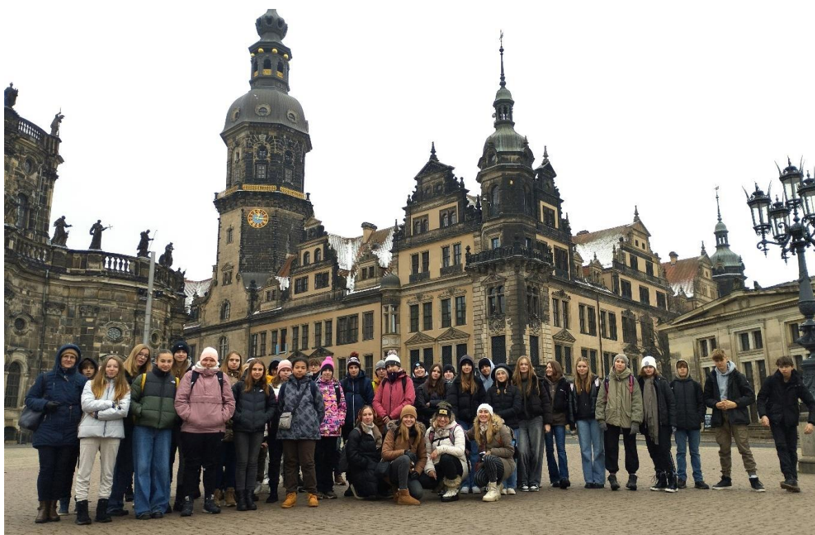
Drážďany 6.- 9.r.